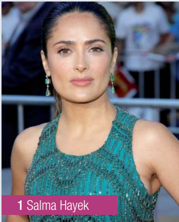
1 Salma Hayek