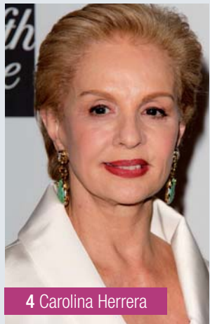
4 Carolina Herrera