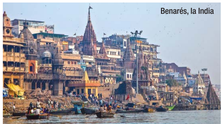
Benarés, la India

Solución de ejercicio 2B: No. Según el texto, el momento del reencuentro está marcado por sensaciones angustiantes, agobiantes y desagradables. Se indica en el texto: «había algo angustioso» y «sentí erizarse mi piel».