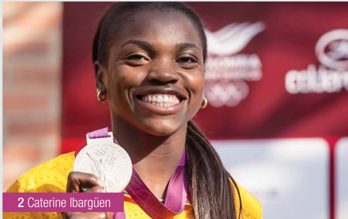
2 Catherine Ibargüen