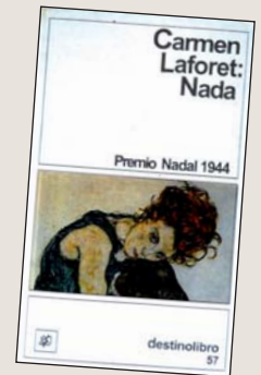
Carmen Laforet, Nada , Editorial Destino, 2006 (primera edición 1944)

En toda aquella escena había algo angustioso, y en el piso un calor sofocante como si el aire estuviera estancado y podrido. Al levantar los ojos vi que habían aparecido varias mujeres fantasmales. Casi sentí erizarse mi piel al vislumbrar a una de ellas, vestida con un traje negro que tenía trazas de camisón de dormir.